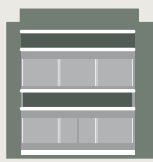
Ιδιωτική Εκπαίδευση - Κοινωνική Μέριμνα